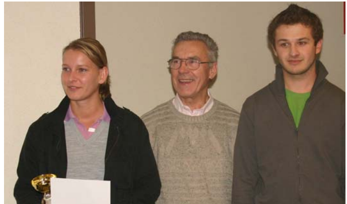
ZA Flughafen Wien II - 8. Platz