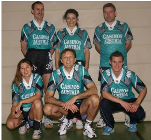
SV Finanz Wien - 5. Platz