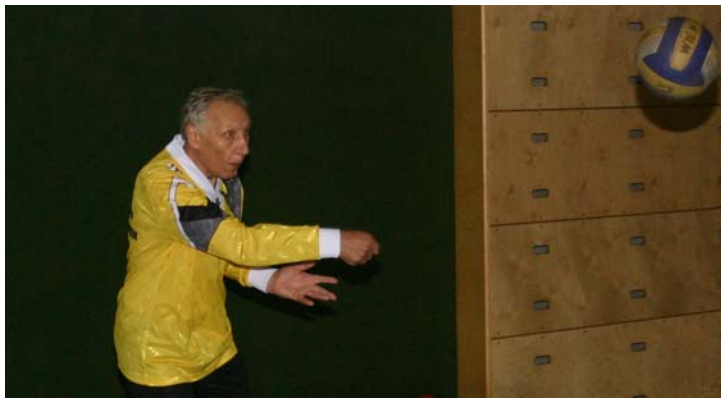
VZBÖ Wien – 2. Platz