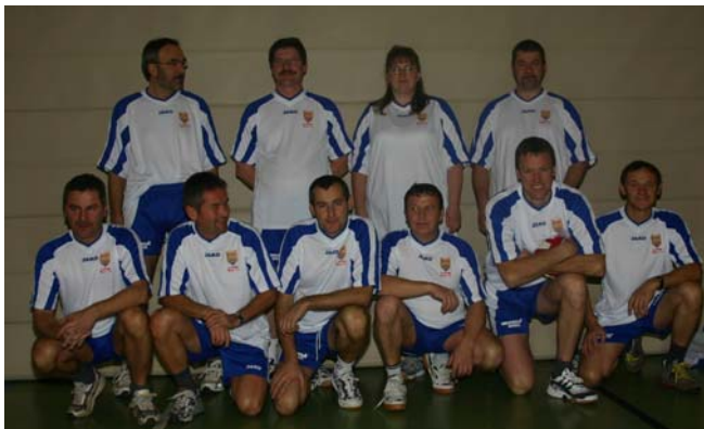
Tirol - 7. Platz