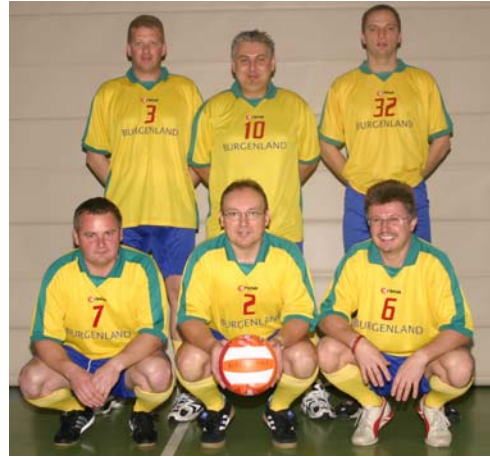
Burgenland - 9. Platz