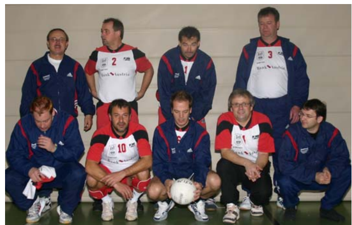
Kärnten – 4. Platz