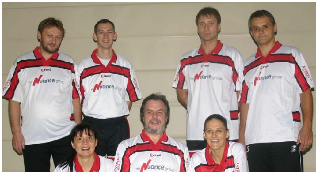
ZA Flughafen Wien I – 1. Platz Und BUNDESSIEGER