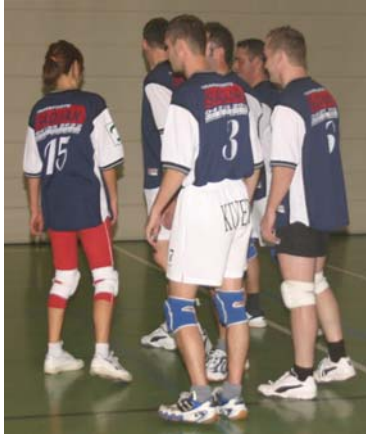
Fachkurs 80.- 6. Platz