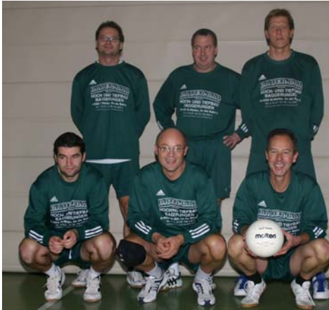
SV Finanz OÖ – 3. Platz